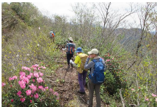
シャクナゲの咲く長い尾根

11:11 鉢伏山に到着、標高 851m。暫しの休憩、行動食をとる。ブナ林が美しい。北東方面に【笠山】という看板を見てから反対の南西方面に進路を変えて笈山を目指す。