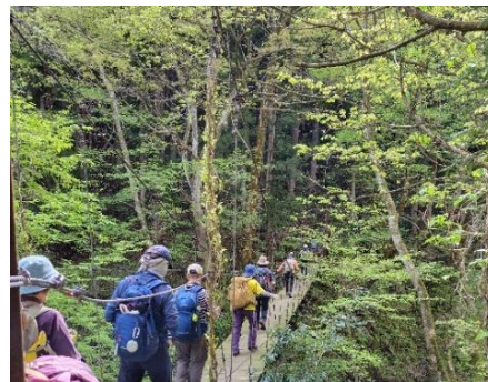
揺れる吊り橋を渡る

吊り橋だけに連なって歩くと、かなり揺れる。手入れの行き届いた杉林の中を歩く。春先の花のチゴユリ、イワウチワ、ヒトリシズカ、ユキザサなど花を見つけては写真を撮る。木洩れ陽でも暖かくて、歩き始めて間もなく汗ばんでくる。