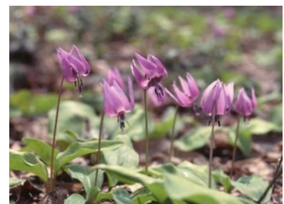
カタクリ