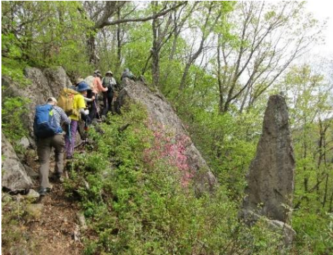
不思議な大岩 足元にも注意！

10:00 ブナ林に入る。新緑と青空が目眩しい！ミツバツツジの深紅の花が咲いている。