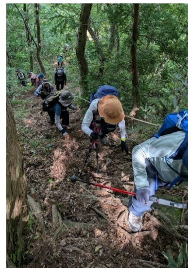
急勾配!木の根やロープにつかまりながら慎重に。