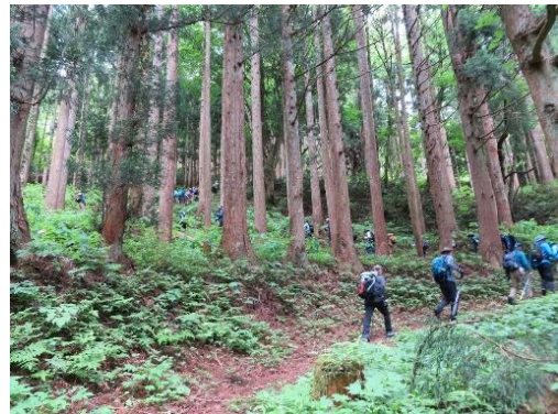
杉木立の中を歩く