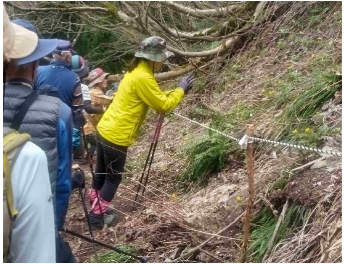
何枚も写真を撮りたくなります