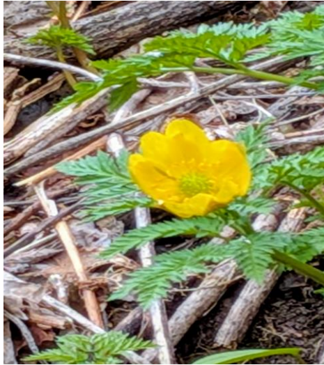
可愛い福寿草に会えました